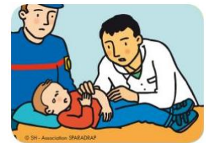
Et si tu as mal ?